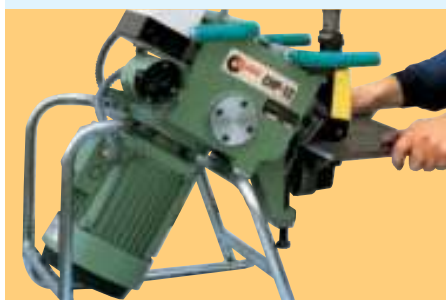
Ejemplo de chaflanado de piezas pequeñas multiformes. Examples of beveling multi-form little parts. Exemples de chanfreinage de petites pièces multiformes.