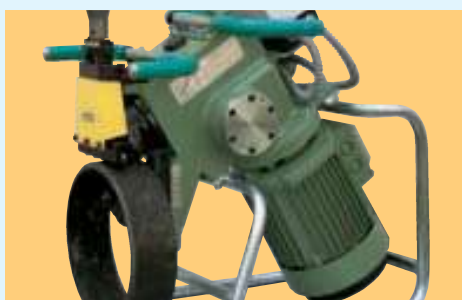
Vista de la máquina realizando la operación de chaflanado en tubos de distinto tamaño. View of the machine beveling tubes of different sizes. Vue de la machine en train de réaliser l'opération de chanfreinage sur des tubes de taille différente.